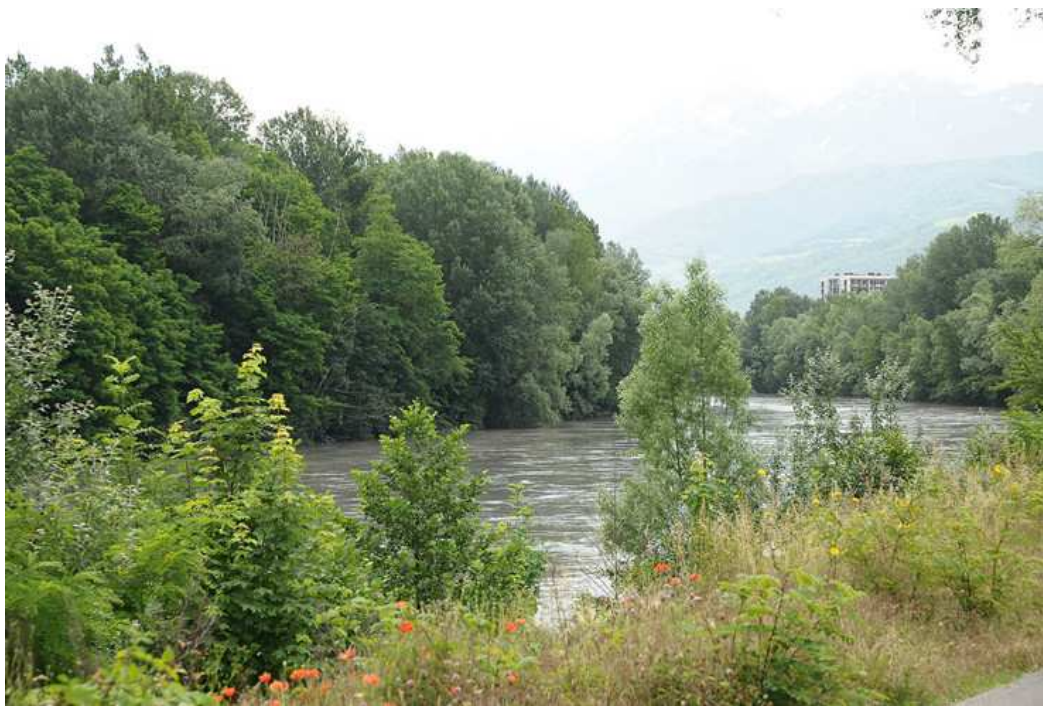
Les berges du Drac