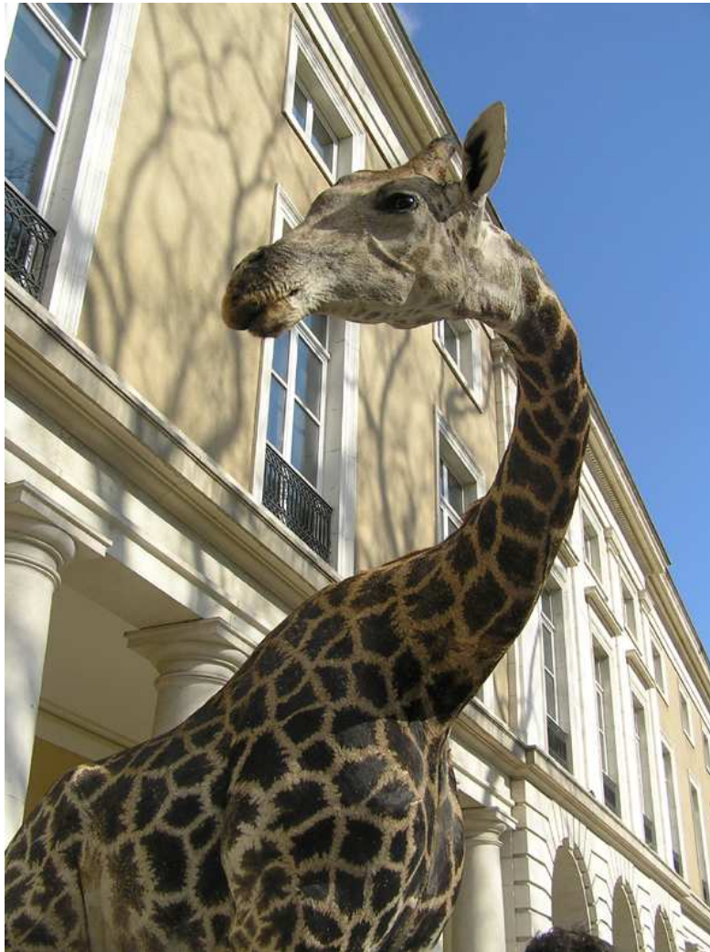
une girafe en plein Grenoble...

- Le module " drôle de ménagerie " nous rappelle combien la présence des animaux et plantes était prégnante dans l'agglomération il y a à peine un siècle. Témoignages, archives : l'homme de l'agglomération vivait entouré de nature sauvage et de nombreuses espèces domestiques, sans oublier les animaux de la ménagerie du Jardin des plantes, célèbres au delà de la vallée.