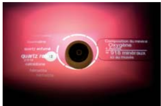
Sur l'écran horizontal, apparaissent des données textuelles et chiffrées. À gauche du palet, l'utilisateur a désormais accès à un menu déroulant contenant le nom de plusieurs minéraux présents dans les réserves du musée et qui contiennent de l'oxygène (ici la tourmaline, le quartz enfumé, le quartz rose, la calcédoine, l'hématite...).