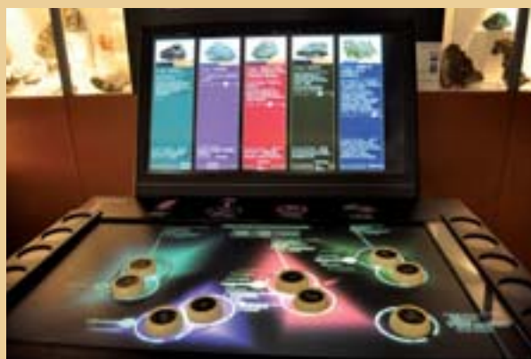
La table tangible à détection d'objets du musée d'Histoire Naturelle de Lille

La table est conçue pour être utilisée par un ou plusieurs utilisateurs en même temps ; le lien chromatique qui s'établit entre le palet déposé et la fiche qui apparaît sur l'écran vertical permettant ainsi de guider le regard des différents utilisateurs.