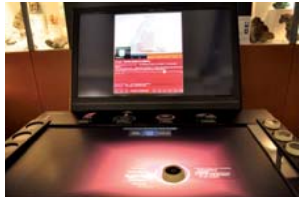
Dès qu'un utilisateur pose un palet-atome sur l'écran horizontal de la table (par exemple de l'oxygène), plusieurs changements s'opèrent et différents types d'information apparaissent sur les deux écrans.

Les situations de visites libres sont plutôt propices à la découverte de la table d'une manière large car les publics sont disponibles pour des expériences inattendues. À l'inverse, les visites scolaires dépendant d'un objectif pédagogique ou d'un travail à faire s'orientent prioritairement vers la recherche de résultats. Mais qu'il