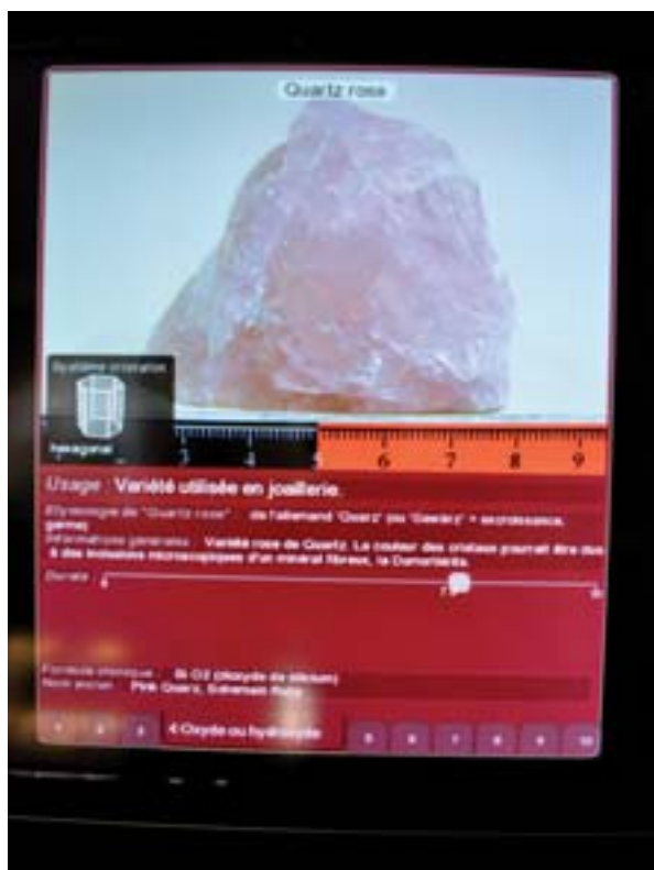
Au moment où l'utilisateur dépose un palet-atome sur l'écran horizontal, des changements interviennent également sur l'écran vertical : une photographie et un texte descriptif du minéral mis en valeur dans le menu déroulant (dans notre exemple : le quartz rose) apparaissent.

Cette étude sur les premiers usages d'une table interactive présentant des fonds numérisés, fondée sur des observations et des entretiens avec des visiteurs individuels et des groupes scolaires a permis de dégager plusieurs aspects et sa valeur ajoutée au regard de l'ensemble du dispositif scénographique ainsi que quelques limites, liées notamment au fait que si le dispositif a bien été pensé en termes de valorisation de fonds patrimoniaux jusque-là invisibles et d'interactivité, la question de la médiation pour des publics réels aurait mérité davantage de réflexion en amont. L'étude a montré l'intérêt de ce type de dispositif pour accéder dans l'espace muséal aux collections conservées dans les réserves, le développement d'une approche esthétique et ludique en plus de son caractère pédagogique, et contrairement à beaucoup d'idées reçues, la capacité de la table interactive à générer non des usages individuels, mais des usages collaboratifs et coopératifs engendrant des rôles différents dans les groupes de visiteurs.