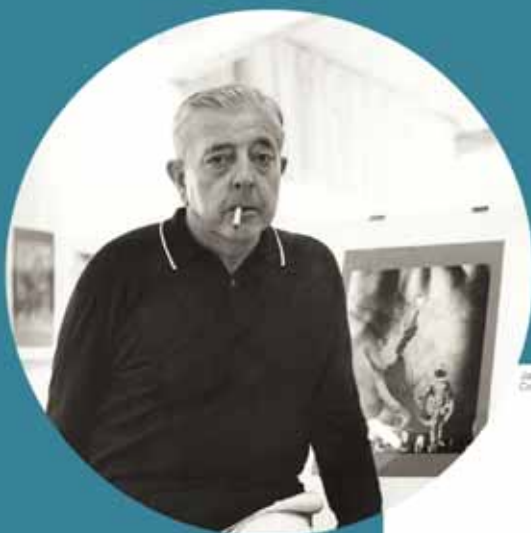
Jacques Prévert lors de son exposition à Antibes, 1952

« Jacques s'exprime de plus en plus par les collages, comme il a fait par les poèmes. Mais je pense que ses collages, au fond, sont des poèmes ».